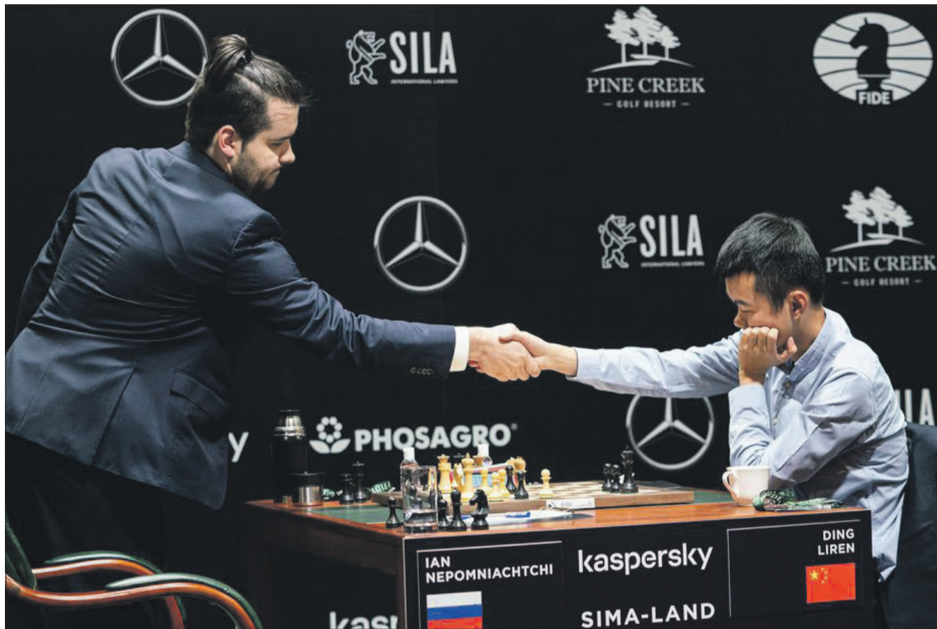
Ian Nepomniachtchi var forståeligt nok meget langt nede i kulkælderen efter VM-matchen mod Carlsen. Matchen endte som bekendt med et kæmpe nederlag+, trods ligestilling halvvejs i matchen. Sejren mod Ding Liren i første runde af dette års kandidatturnering har dog givetvis hjulpet gevaldigt på humøret, hvilket er temmelig bekvemt for en humørspiller som ham. Om det så kan række helt til at vinde kandidatturneringen igen, må tiden vise.