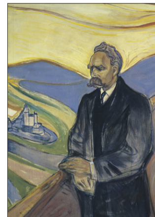
Den tyske forfatter Friedrich Nietzsche udgav sit storværk Also Sprach Zarathustra i 1885 efter næsten 3 års arbejde.