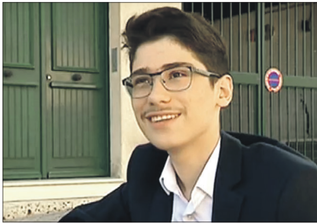
Alireza Firouzja fik endelig gang i spillet i 9. runde af Kandidatturneringen, hvor Richard Rapport fra Ungarn fik ballebank. En tiltrængt sejr for angrebskakken, der ellers har det svært i en tid, hvor de fleste topspillere forsvarer sig ufatteligt godt og de fleste tilløb til at skabe skaksymfonier ender med knuste hjerter, som Heinrich Heine så smukt skrev det for 200 år siden.