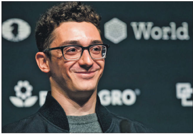
Fabiano Caruana fra USA har spillet godt ved Kandidatturneringen og er reelt den eneste, der kan true russiske Ian Nepomniachtchi, som har kurs mod en gentagelse af sidste VM-finale mod Magnus Carlsen. I artiklens parti vover Caruana sågar et modigt springeroffer i 11. træk mod landsmanden Nakamura, der dog reagerer med forsværsspil, som det italienske herrefodboldlandshold i 80'erne ville være stolt over.