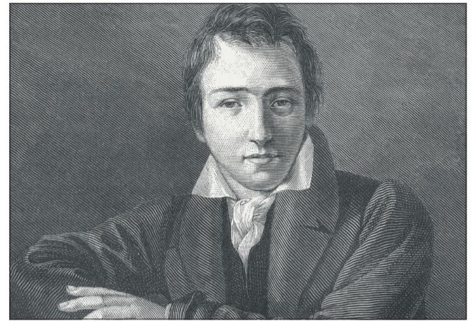
Den store tyske digter Heinrich Heine (1797-1856), hvis digte om ung kærlighed forbløffende nok kan bruges som billede på moderne topskak.