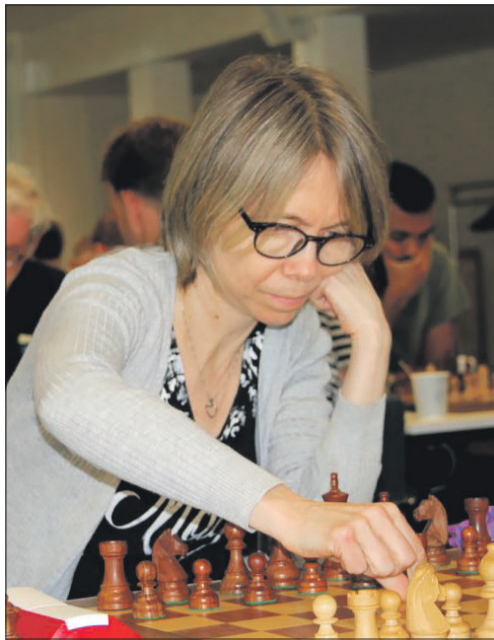
Topscorer på førstebræt ved OL med 9½/11 og et levende bevis på at gode skakspillere aldrig ældes; GM Pia Cramling fra Sverige.