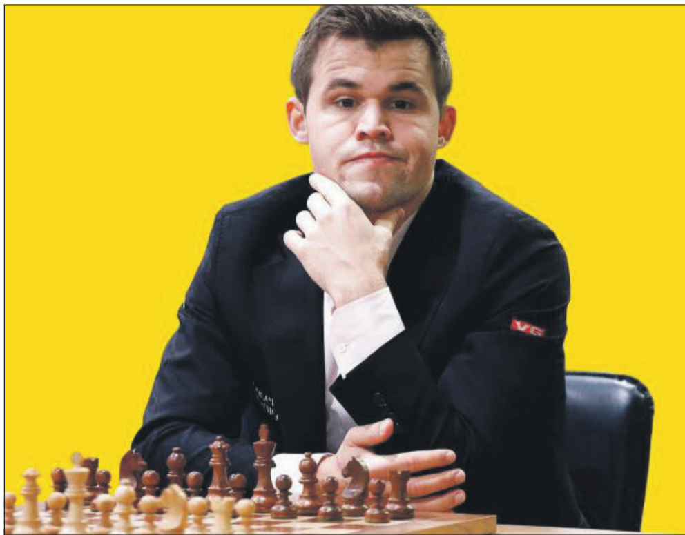
GM Magnus Carlsen, der for første gang i sin skakkarriere har trukket sig fra en igangværende skakturnering, som reaktion på alt for mystisk spil fra en af konkurrenterne. Intet snyd er afsløret, men betyder det også, at intet snyd finder sted? - det er det store spørgsmål.