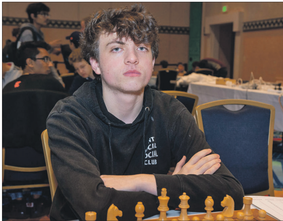
GM Hans Moke Niemann. 19 år og fra USA. Enten en gedigen svindler, der bruger skakcomputere under partierne eller én af de allermost lovende unge spillere i skakverdenen? - Det er ikke rigtig nogen vej midt i mellem.