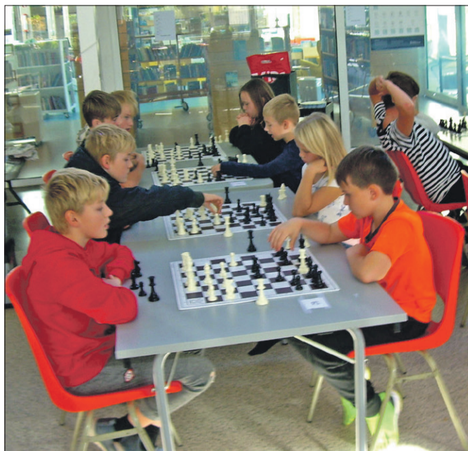
Der er ikke mange sportsgrene, hvor elever fra 3. klasse og elever fra 8. klasse kan dyste på helt lige betingelser. Det kan de heldigvis i skak, som man kunne opleve det i skakkampen mellem Nørre Alslev Skole og Gåsetårnskolen.