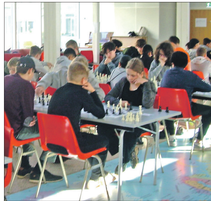
Der var maksimal koncentration over hele linjen, i skolekakkampen mellem Nørre Alslev Skole og Gåsetårnskolen fra Vordingborg. En flot gang Hjernerens Motionsdag, som en passende optakt til den rigtige Motionsdag, der jo finder sted i morgen over hele landet.