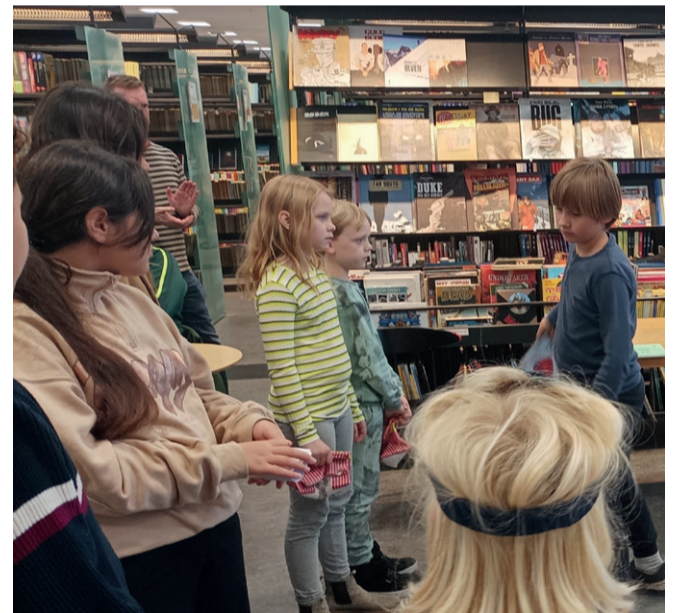
Smil og udmattelse hos deltagerne under præmieuddelingen. Fire timers skak er ganske hårdt for de fleste, især når modstanden er hård i alle spil. Alle lovede dog at være friske igen til den 18. marts 2023, når turneringen gentages.