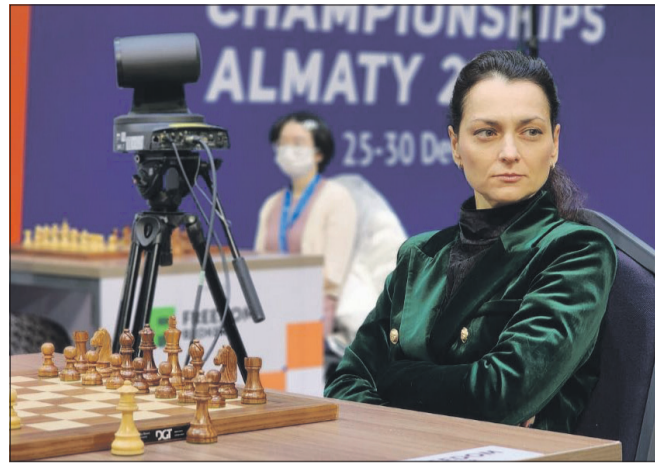
Den forsvarende verdensmester i hurtigskak for kvinder GM Alexandra Kosteniuk er også i år med i toppen, men med 1 point op til en trio og kun 3 runder igen bliver det svært at forsvare titlen. Alexandra Kosteniuk var én af de 43 russiske stormestre, som i april underskrev et brev til Putin, med protest mod krigen i Ukraine.