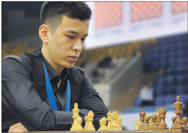
Den forsvarende Verdensmester i hurtigskak for herrer GM Nodirbek Abdusattorov fra Usbekistan måtte lægge ryg til en alvorlig lektion fra Magnus Carlsen i 4. runde af det igangværende VM. Abdusattorov er trods det kun ½ point efter den barske nordmand med 4 runder igen, så muligheden for et titelforsvar er der bestemt endnu.