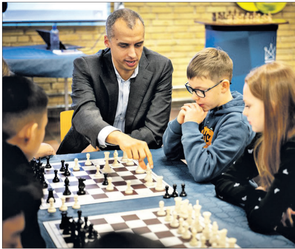
Børne- og undervisningsminister Mathias Tesfaye åbnede Skolernes Skakdag på Frydenhøjskolen i Hvidovre, ikke mange km fra hjemmet i Albertslund. Udover et par gode spil skak kunne ministeren glæde sig over, at mere end 47.500 skoleelever tog imod hans nylige opfordring til dem, om at løfte blikket fra skærmene og se lidt mere på hinanden. Ikke noget dårligt råd.