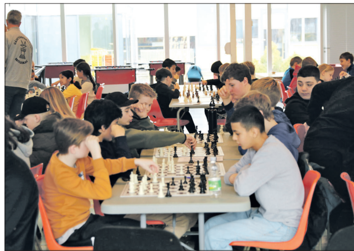
På Gåsetårns skolen i Vordingborg bød 160 elever fra 1. til 9. årgang hinanden op til kamp på de 64 felter, da Skolernes Skakdag rullede over landet fredag den 10. februar. Det er ikke tit man på en skole kan indbyde til konkurrencer, hvor elever med så stor aldersspredning kan deltage på helt lige vilkår, så det er en helt særlig dag for både store og små.