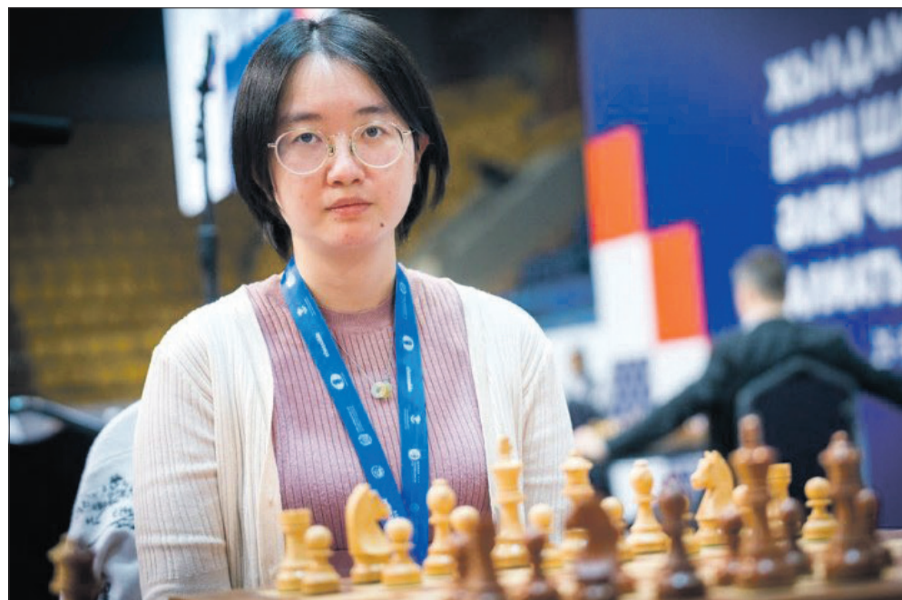
Deltager i kvindernes kandidatfinale i skak: Tan Zhongyi fra Chongqing i Kina.