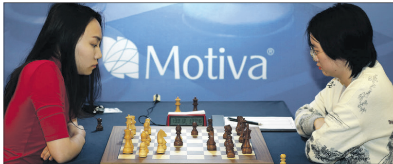
Finalisterne i Kandidatfinalen i skak for kvinder, Lei Tingjie til venstre mod Tan Zhongyi. Efter en flot match, der logisk nok blev spillet i Chongqing, der er begge spilleres hjemby, sejrede Tingjie med cifrene 3½-1½ og vandt dermed retten til at udfordre VM Ju Wenjun i en match om VM-titlen. Wenjun er ligesom de to andre fra Kina, der virkelig fører en indenfor kvindeskakken.