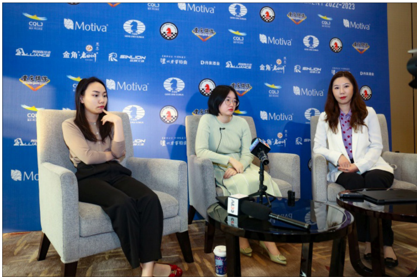
GM Lei Tingjie og GM Tan Zhongyi, interviewet til nationalt tv i Kina efter det afgørende femte parti i matchen, der sikrede Tingjie en match om VM mod den forsvarende mester GM Ju Wenjun.