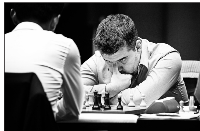
Ian Nepomniachtchi i vanlig angrebspositur i matchen mod Ding Liren, der jo simpelthen gælder retten til at sætte sig på den vm-trone, Magnus Carlsen har fraskrevet sig retten til. Indtil videre er alt meget spændende, med en kneben føring til på 4-3 til Nepo efter 7 af matchens 14 partier.

Næstved Skakklub spiller hver mandag fra kl. 17 på Grønnegades Kaserne 1.sal, bygning 1 Alle er velkomne